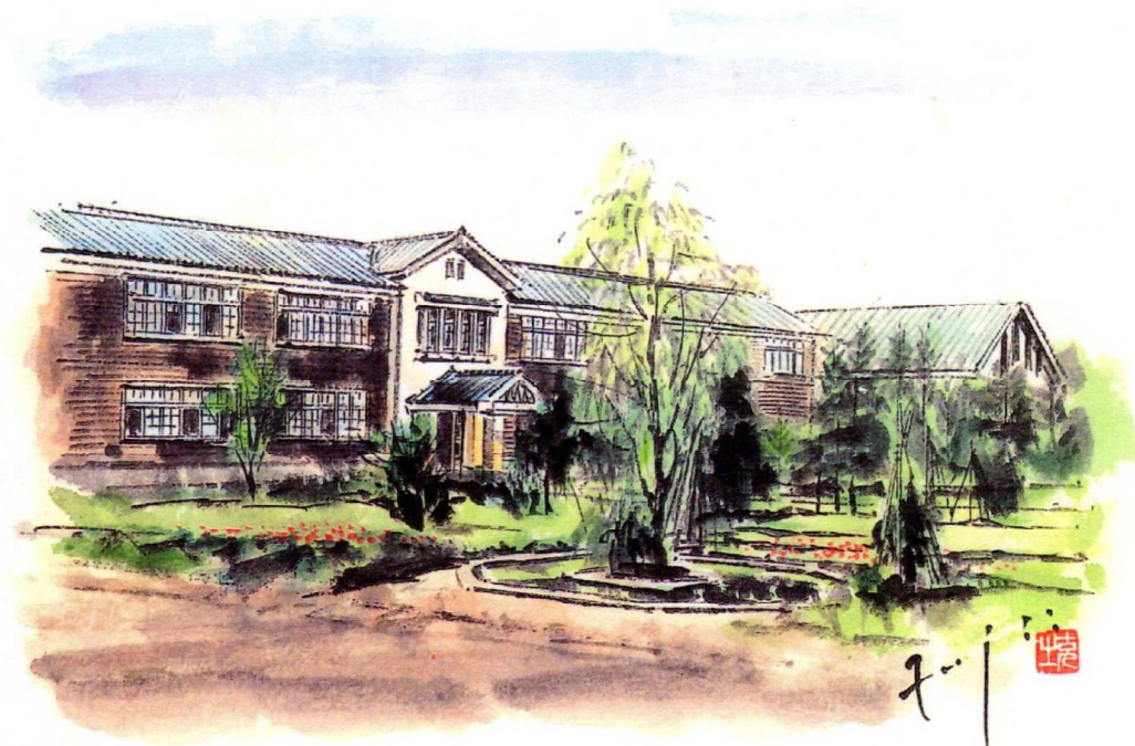
昭和三十八年頃の長岡工業高校校舎風景 藤井克之／画