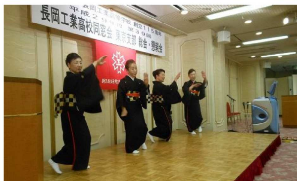
佐渡稽古舞の皆さんによる踊り