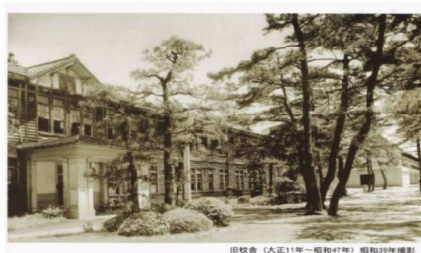
思い出の木造校舎

その後、村松工業学校は明治 42 年に長岡移転となり、長岡工業高校となりました。