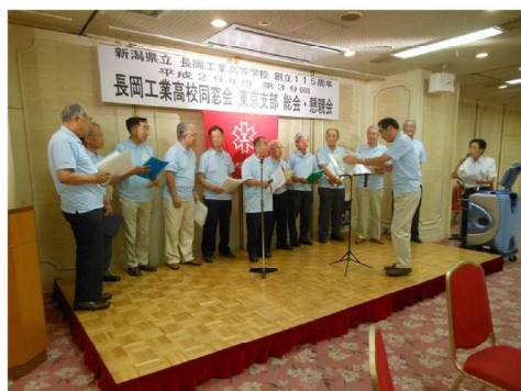
コーラス同好会による合唱