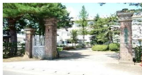
登録文化財指定「校門」