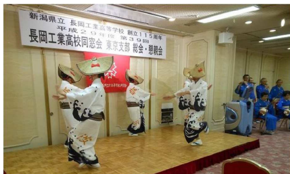
若波会による佐渡おけさ