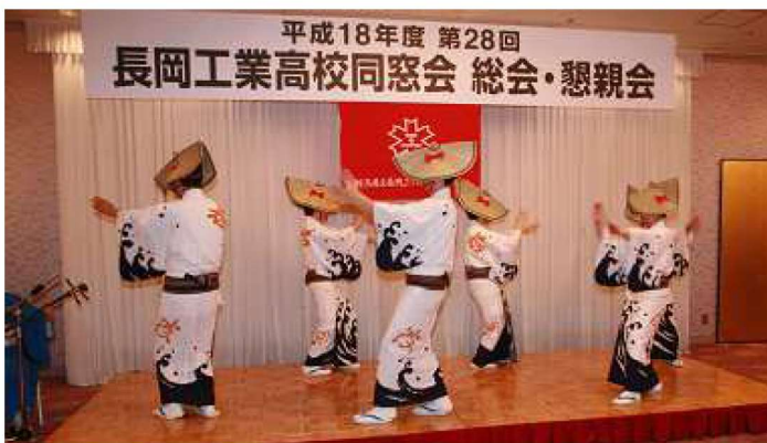
佐渡相川高校OBの皆さんによる佐渡おけさ