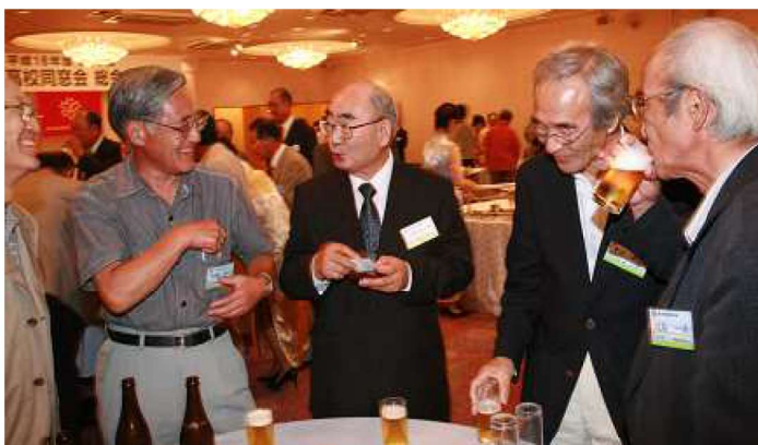
会話のはずむ懇談風景