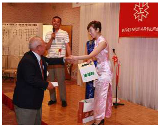
楽しい嬉しい抽選会