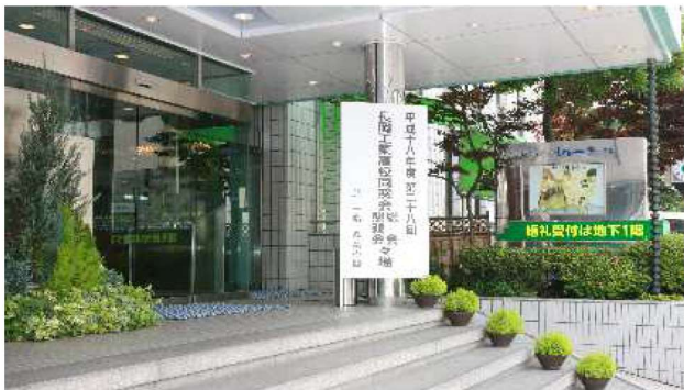
会場：池之端文化センター