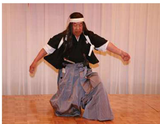
アトラクション 剣舞