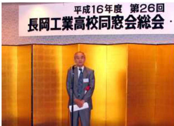
前東京支部中野支部長のご挨拶