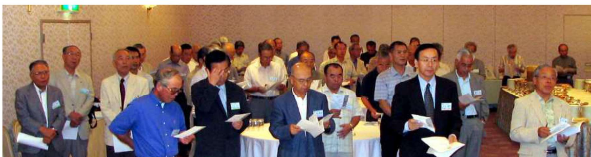
開会宣言後、全員で校歌の斉唱