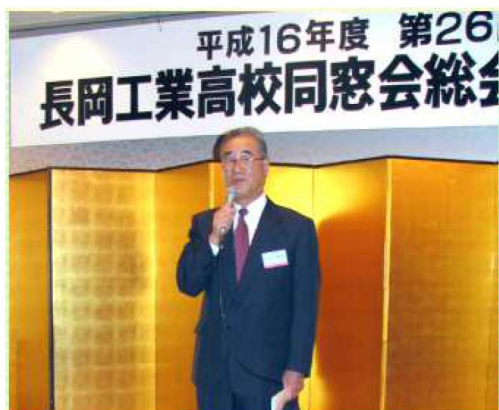
並木新会長のご挨拶