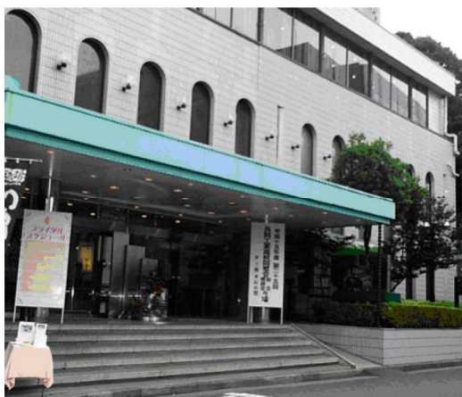
会場の上野池之端文化センター

平成 16 年 7 月 11 日、各科統合後 2 回目の総会を開催しました。本年度は、東京支部の役員改選の年にあたり、新役員を選出を行いました。また、恒例となった 70 歳以上功労者の表彰や抽選会が行われました。